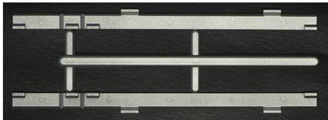
写真は試作品です。

グリーンマックスで製品化されているエコノミーキットなど旧動力に対応した製品に、手軽にコアレスモーター動力ユニットを取り付けられるアダプターを製品化します。