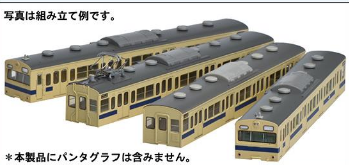
写真は組み立て例です。