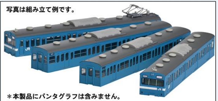
写真は組み立て例です。