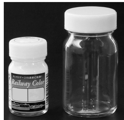
左)通常サイズ(18ml)、右)特用サイズ(50ml)