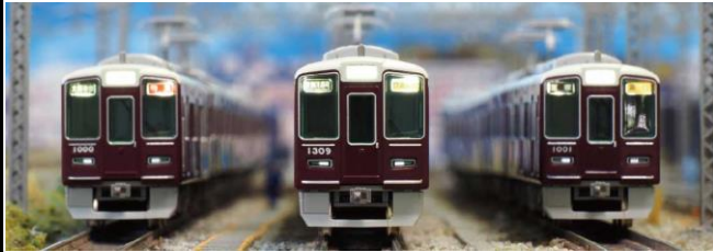
※画像は試作品を貼り付けたイメージです。 阪急電鉄商品化許諾申請中