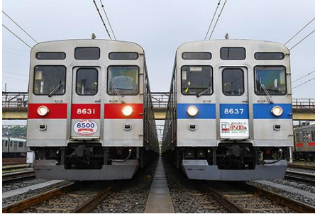
東急電鉄株式会社商品化許諾申請中

東急電鉄8500系は地下鉄半蔵門線相互乗り入れに対応するため、8000系をベースに1975年から登場した車両です。製造時期によりコルゲート形状・屋根断面・窓枠等の形態に差異があります。2003年からは田園都市線～半蔵門線～東武伊勢崎線(現東武スカイツリーライン)直通運転に伴い、東武線内でも活躍しています。近年は車端部に黄色テープが貼付されています。 8500系8631編成は2022年4月からは「ありがとうハチゴプロジェクト」の一環として車両前面にオリジナルヘッドマークを掲出して2022年5月まで活躍していました。8500系8637編成は「Bunkamura号」として活躍していますが、2022年4月からは「ありがとうハチゴプロジェクト」の一環として車両前面にオリジナルヘッドマークを掲出しています。 また東急電鉄8500系は2023年1月をもって定期運行終了を予定しています。