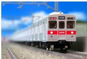
写真は試作品です。別売のライトユニットを取り付けています