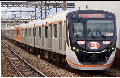
東京急行電鉄株式会社商品化許諾申請中

東急6020系は大井町線の急行列車用に導入された新型車両で、田園都市線用2020系と車体外観、車内の造作、基本的な性能などが同じ仕様で製造されています。 2018年12月14日から、平日夜の帰宅時着席ニーズに応えるため有料座席指定サービス「Q SEAT」として、中間車1両をロングシートからクロスシートへ転換できる車両に置き換えて、大井町発・田園都市線直通の急行長津田行きとして運行が開始されました。