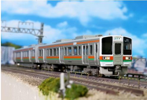
※写真は試作品の組立見本です。 JR東海商品化許諾済

211系は、国鉄時代の1985年(昭和60年)に登場したステンレス車体の直流近郊型電車で、国鉄分割民営化に伴いJR東日本・JR東海各社に継承されました。その後も各社において使用線区に対応した新たな区分により製造された車両も多く、6000番台は2両編成を組むため213系5000番台のシステムを組合わせた車両です。当初は御殿場線用として投入されましたが、現在は東海道線を中心とした運用で使用されています。