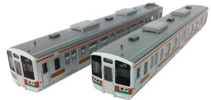
↑封入 ボディの組み立て見本です。