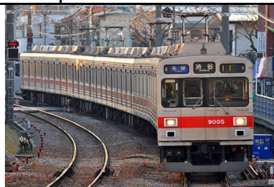
東急電鉄株式会社商品化許諾申請中

東急電鉄9000系は1986年から導入された東急電鉄初のVVVF制御を採用した車両で、東横線に8両編成が14本、大井町線に5両編成が1本投入されました。車体は東急電鉄の標準的な切妻20m車ながら、将来の地下鉄乗入を想定して前面に非常用貫通路がオフセットして設置されているのが特徴です。東横線用の車両は2009年より5050系による置き換えが始まり、2013年までに全車が編成組み換え、カラーリング変更などが行なわれ大井町線に転属しました。